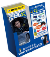
カタログスタンド