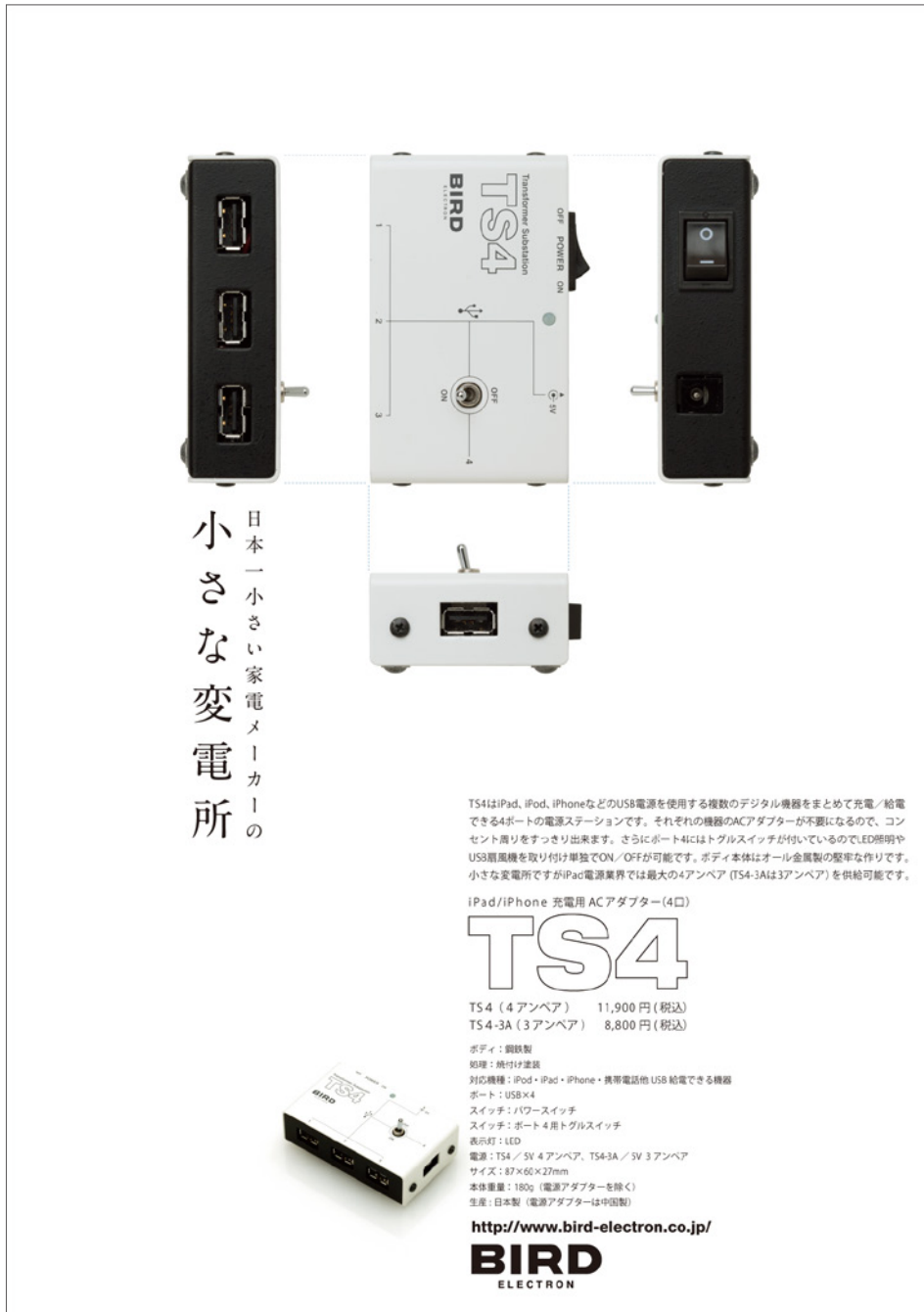
BIRD電子/展示会用ポスター(B1)