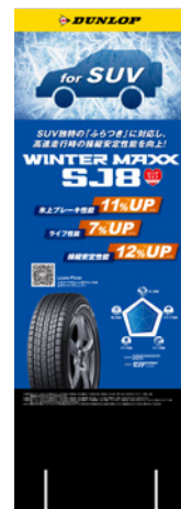
背面ラインアップボード