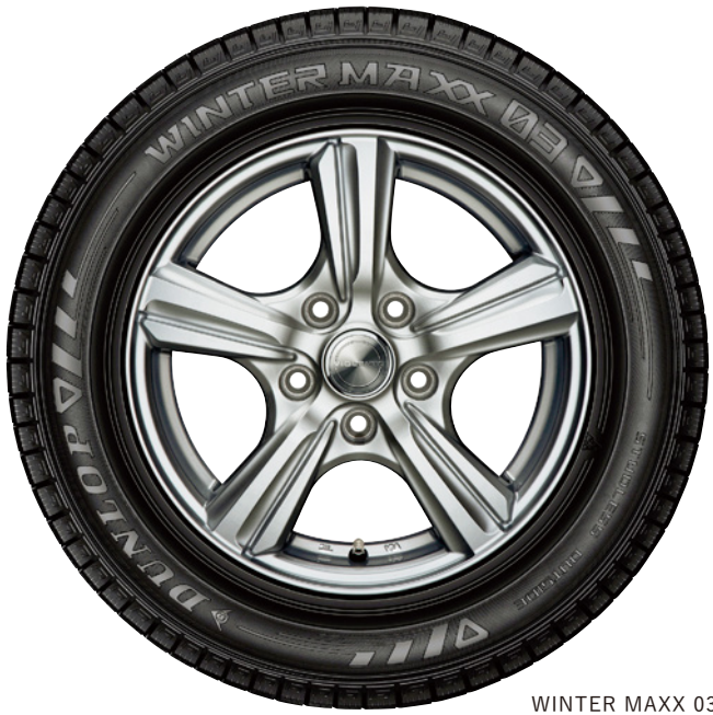
WINTER MAXX 03