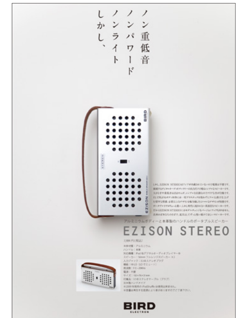
BIRD電子/展示会用ポスター(B1)